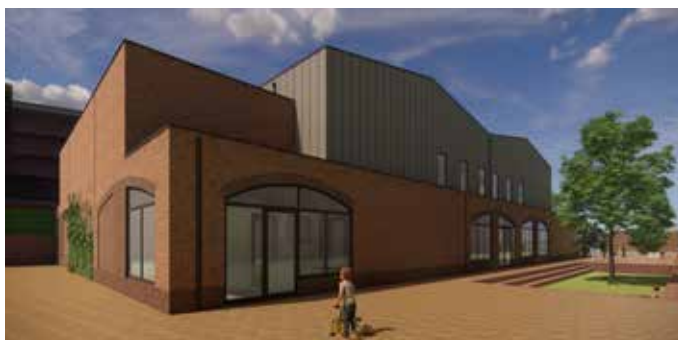
Sportzaal gevel oostzijde