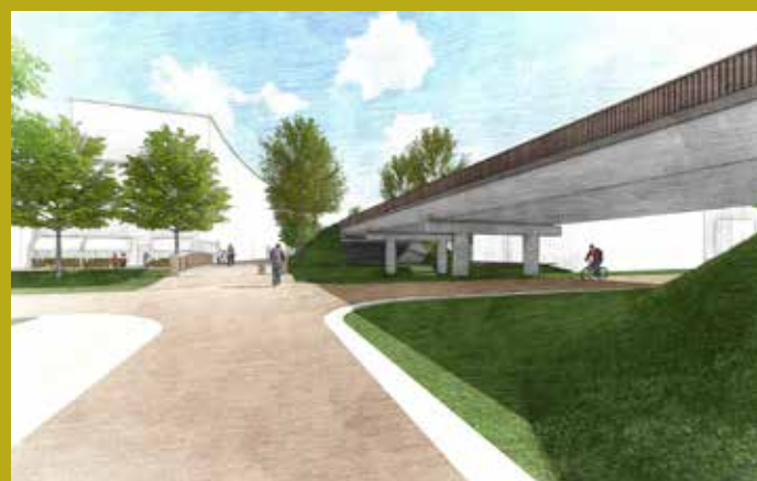
Impressies van het viaduct Laan van Bovenduist