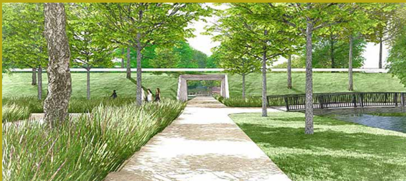
Impressie van het laantje naar de nieuwe locatie HC Eemvallei