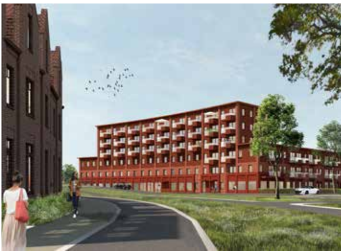
Impressie vanaf de Laan van Bovenduist

De verwachting is dat de bouw start in voorjaar 2025. In het voorjaar van 2026 worden de woningen opgeleverd en kunnen de zorgvoorzieningen starten met de inrichting van de praktijkruimtes. Naar verwachting zullen zij rond de zomer 2026 de deuren openen.