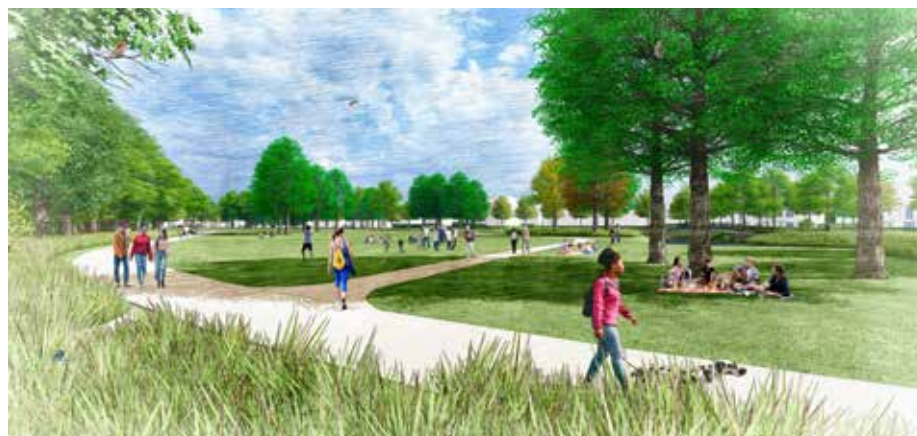
De Parkbaan biedt ruimte sport te beoefenen, te wandelen, fietsen en skaten

De Parkbaan is een brede (geasfalteerde) route door het park waar gewandeld, gefietst, geskatet en hardgelopen kan worden.