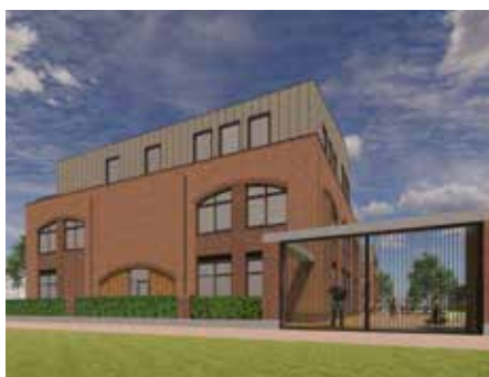
Ingang scholencluster westzijde

De verwachting is dat de bouw medio 2025 start en dat de leerlingen begin 2027 in het nieuwe schoolgebouw les krijgen.