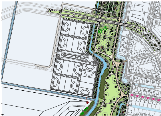
Verkavelingstekening ligging hockeyvelden