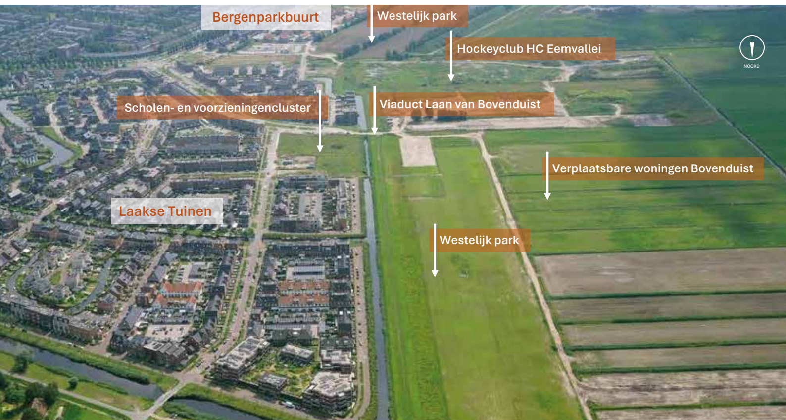
Luchtfoto Laakse Tuinen en locatie Westelijk park met alle voorzieningen, kijkend in zuidelijke richting. Onderaan de foto stroomt de Laak.