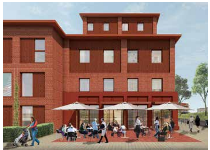
Impressie horecavoorziening hoek Westelijk park