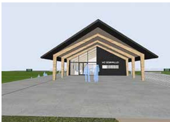
Impressie aanzicht clubhuis