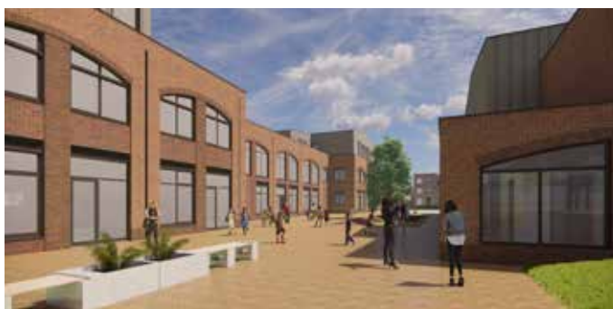
Gevel en schoolplein zuidzijde